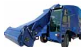
Самоходный кормосмеситель VS22